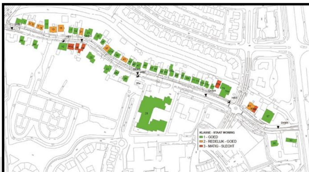
Voorbeeld risicokaart kwetsbare bebouwing.